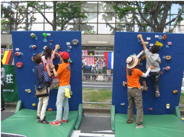
チャレンジクライミング